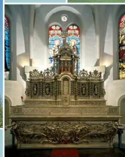
Guentrange, église Saint-Urbain Maitre-autel provenant de l'ancien couvent des Capucins vendu à la paroisse en 1792