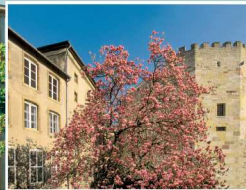
Musée de la Tour aux Pucés