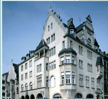
Ancien Hôtel Schillerhof inspiré par la Renaissance allemande (1906)