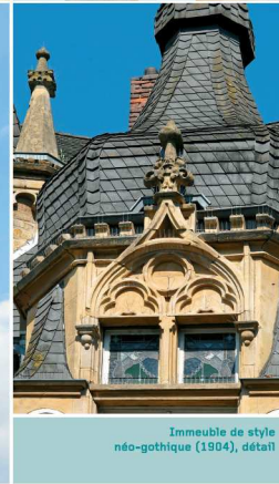
Immeuble de style néo-gothique (1904), détail