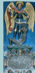
Beuvange-sous- Saint-Michel, chapelle de l'ermitage, haut-relief de Saint-Michel archange (1586)