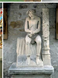
Eutrange, statue du Bon Dieu de Pitié attribuée au maître de Mairy (vers 1530)