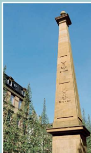
L'autel de la Patrie (1796), dernier monument de ce type conservé en France