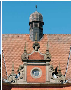
La Poste, de style néo-Renaissance (1907), détail