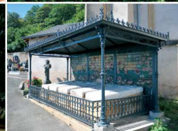
Volkrange, tombeau de style Art Nouveau, de la famille Bompard-Marchal