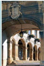
Hôtel de ville, ancien couvent des Clarisses (1695)